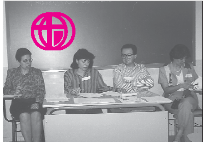
Exposición del trabajo en grupos

Más de 50 profesionales sanitarios reflexionaron n sobre su misión y sobre la acción sanante del Espíritu en sus vidas.