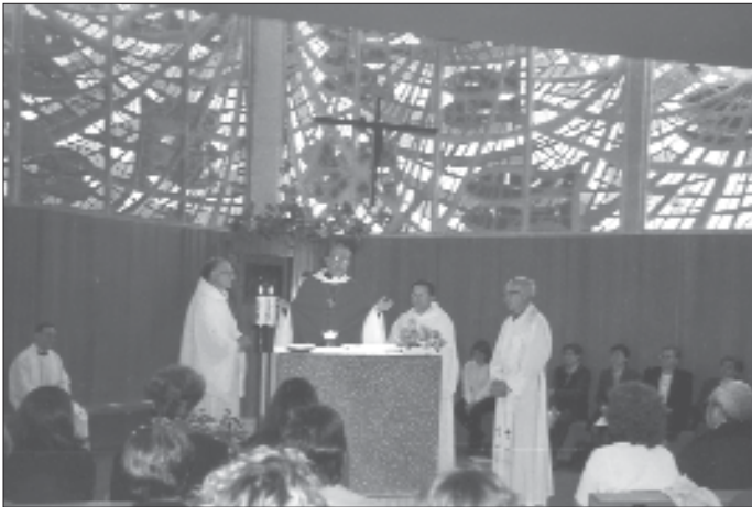
Eucaristía final de la II Jornada Catalana de PROSAC