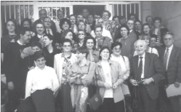
Asistentes a la III Jornadas de PROSAC en Zaragoza